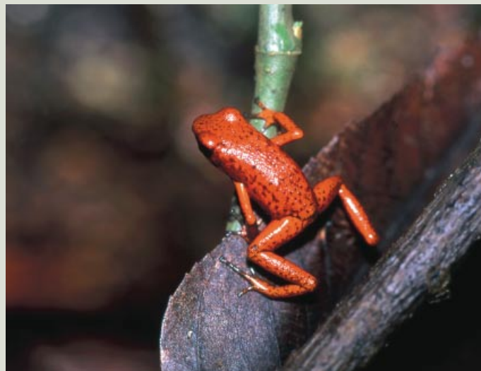
Giftiges Hautsekret bewahrt die Pfeilgiftfrösche davor, gefressen zu werden.