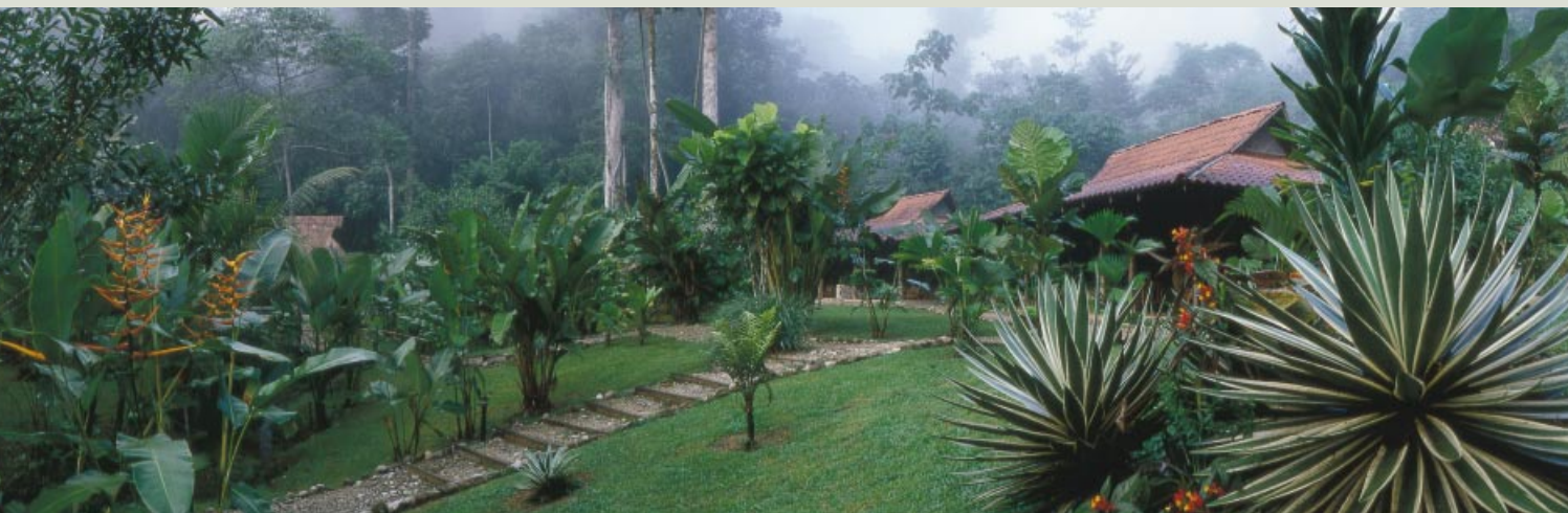
Die Esquinas Rainforest Lodge im wilden Süden Costa Ricas ist Teil des Modellprojekts „Regenwald der Österreicher“, bei dem durch Landkauf aus Spendengeldern Regenwaldgebiete vor dem Abholzen bewahrt werden. Werner Kenzel verbrachte hier schon viele Monate, um zu fotografieren.