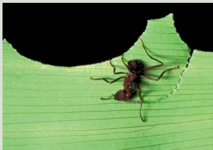
Blattschneiderameisen schneiden unermüdlich Blattstücke von den Urwaldriesen, tragen sie in ihren unterirdischen Bau und produzieren damit eine Art Kompost, auf dem sie eine spezielle Pilzart zu ihrer Ernährung züchten.