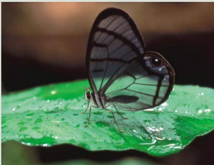
Glasflügler sind im Dämmerlicht des Regenwaldes nur schwer zu entdecken.